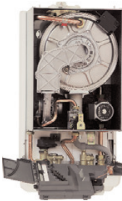
Innenbild Gerät. (Werkbilder FERRO www.ferro-waermetechnik.de )

Die Geräteserie FERRO GAS WK/WKM 15-45 kW ist seit Herbst 2007 in der Markteinführung und stößt auf sehr positive Resonanz beim Fachhandwerk.